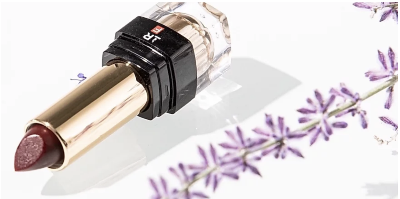
Le Rouge Français s'installe chez Obratori

par Richard Michel · 11 décembre 2019 à 09h01 (modifié le 11 décembre 2019 à 09h02) À LA UNE